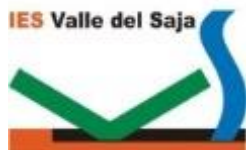
IES VALLE DEL SAJA. 20-12-18