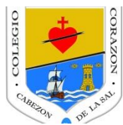
CEIP SAGRADO CORAZÓN. 25-2-19