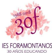
IES FORAMONTANOS. 16-4-19